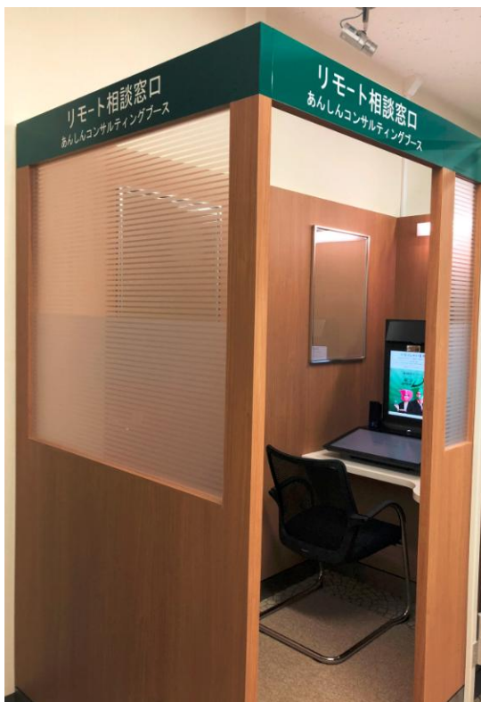
▲リモート相談窓口 あんしんコンサルティングブース (設置店：亀田支店、大野支店、燕支店)